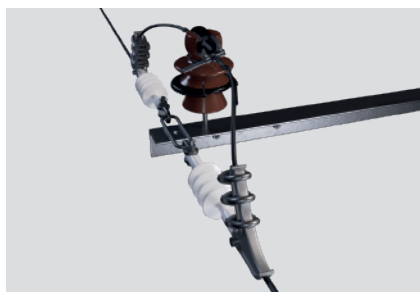
Установка ИРШФМК совместно с натяжной полимерной изоляцией