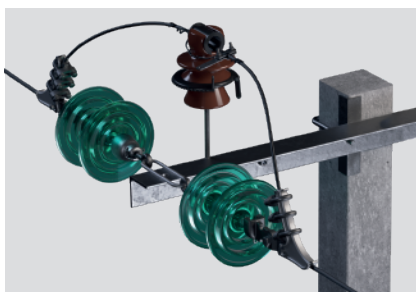
Установка ИРШФМК совместно с натяжной стеклянной изоляцией