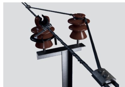
Установка ИРШФМК на промежуточной опоре с двойным креплением провода